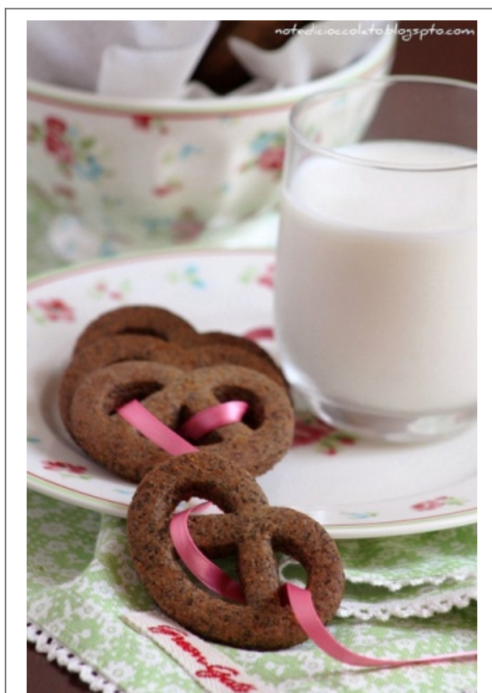
Tessuti e porcellane Green Gate

Immaginate un pulcino nero e infreddolito (la sottoscritta!) in una giornata d'inverno in libreria.