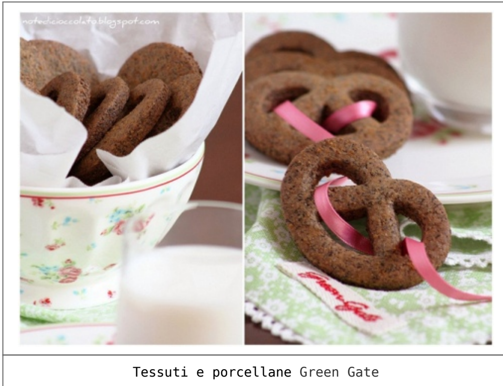
Tessuti e porcellane Green Gate

[ricetta adattata da Regali golosi di S.Verbert]